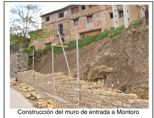
Construcción del muro de entrada a Montoro